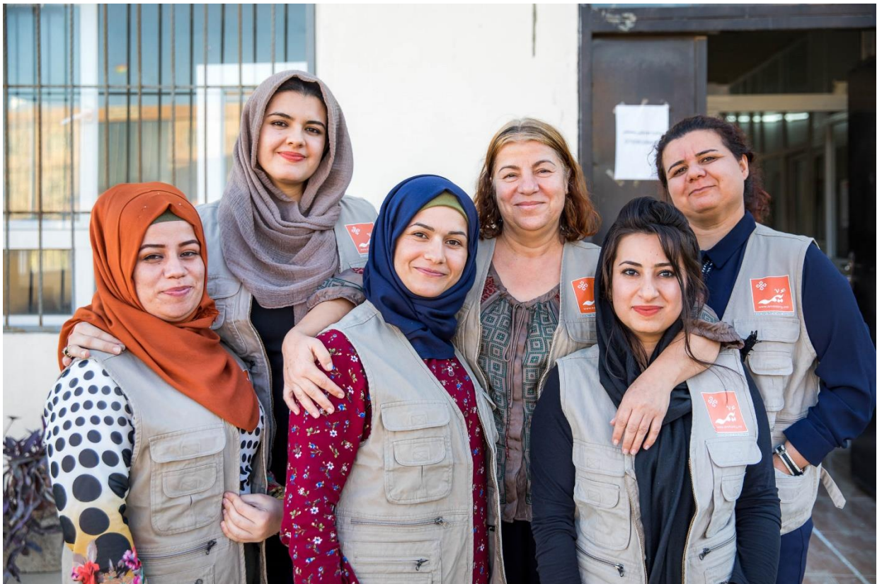
medica mondiale-Partnerorganisation EMMA im Irak.